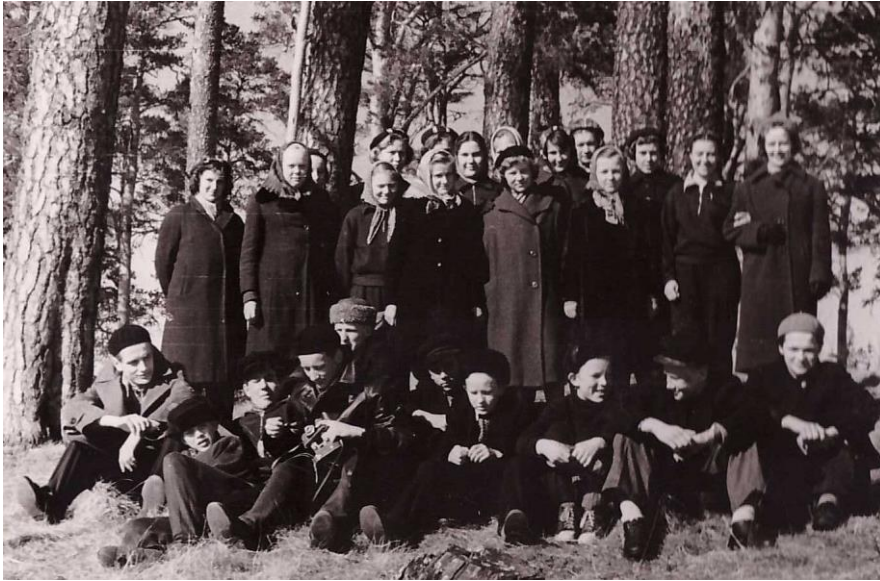
Kohtumine Holstre 8-kl kooli 7.klassiga