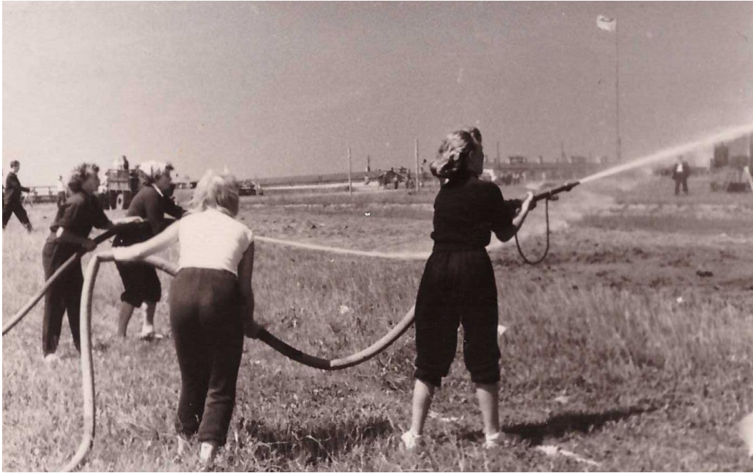
Viljandis võistlustel, 9.klass