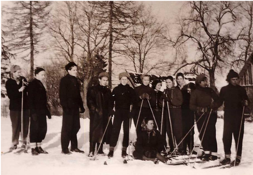
Matk mööda „Koidu“ kolhoosi, Tossu sigala juures