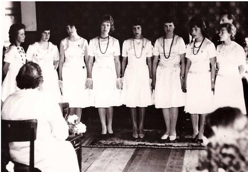
Klass lõpulaulu esitamas