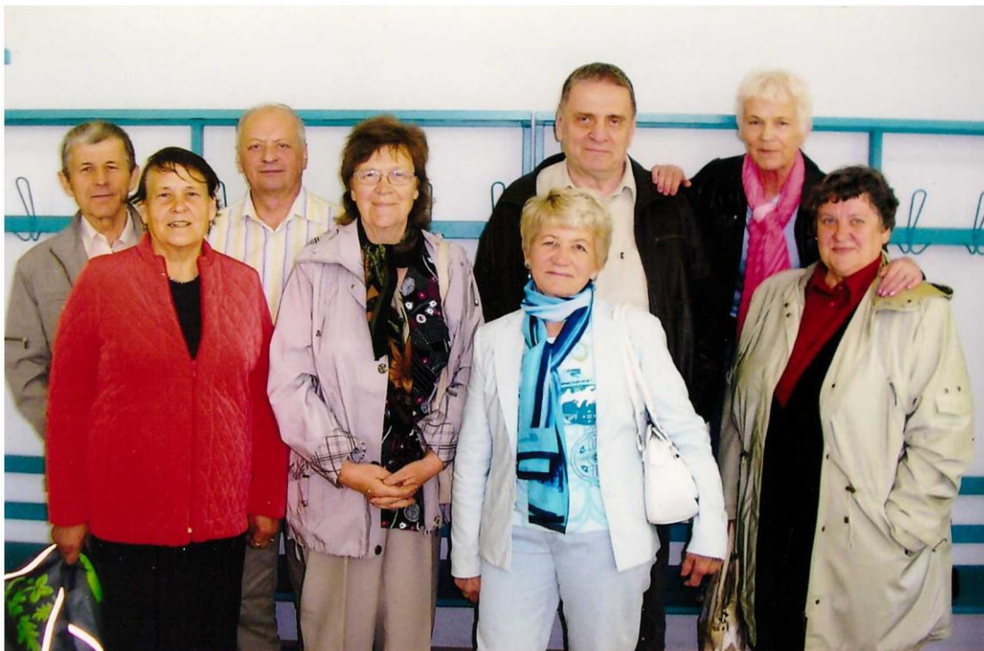
50 aastat lõpetamisest koduklassis (11.kl) 9.06.2012