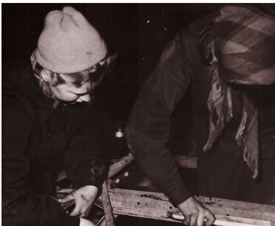
Praktikatunnis 9.kl 1960