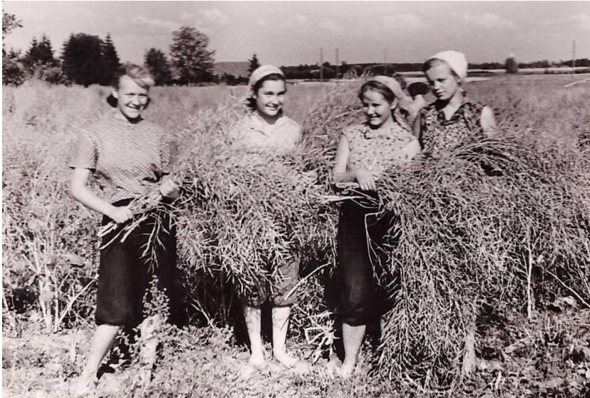
Söödakapsa seemnepuhmikuid koristamas

Teoreetilised loengud olid igal reedel peale tunde 2-3h korraga. Neid andsid: