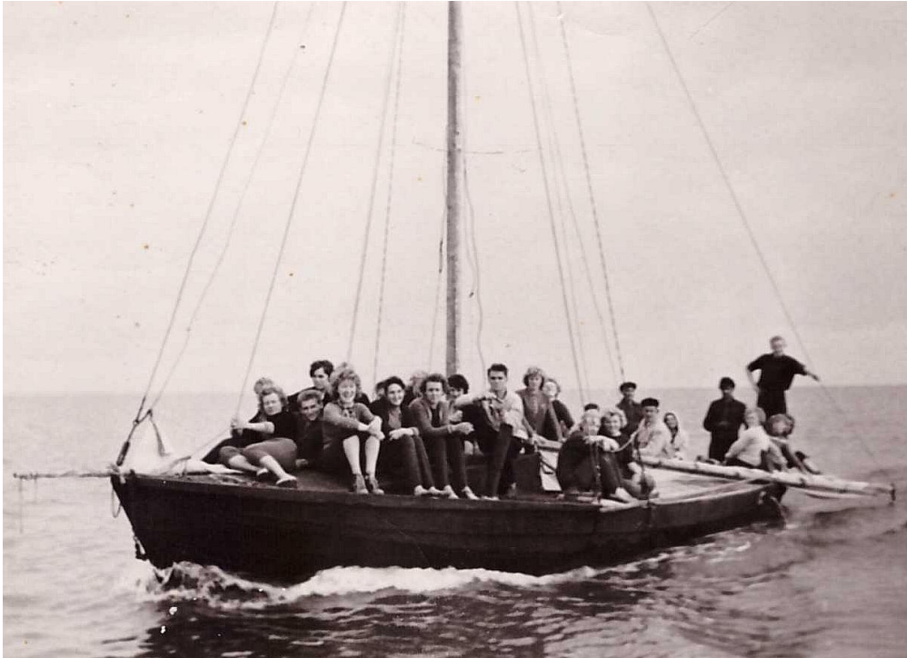
Suvepäevad Võrtsjärve ääres Oiul 1962

Oma luulevihikust leidsin järgmised salmid.