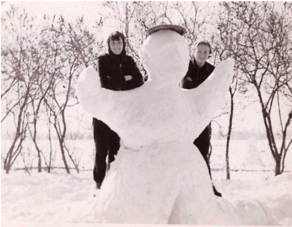
Kivilõppe 7-kl kooli juures 10.01.1960